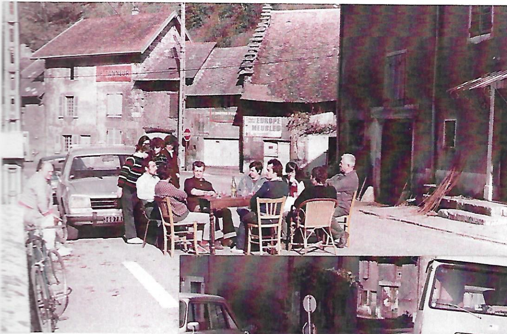
28 octobre 1982 : Enfin on respire autour de la table installée au milieu de la chaussée devenue communale.